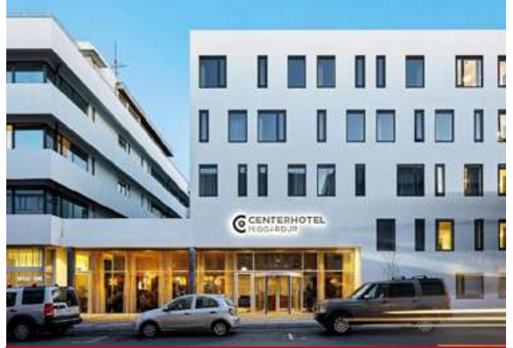
Midgardur by Center