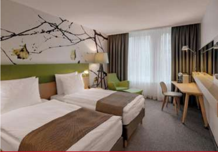
Holiday Inn Frankfurt Alte