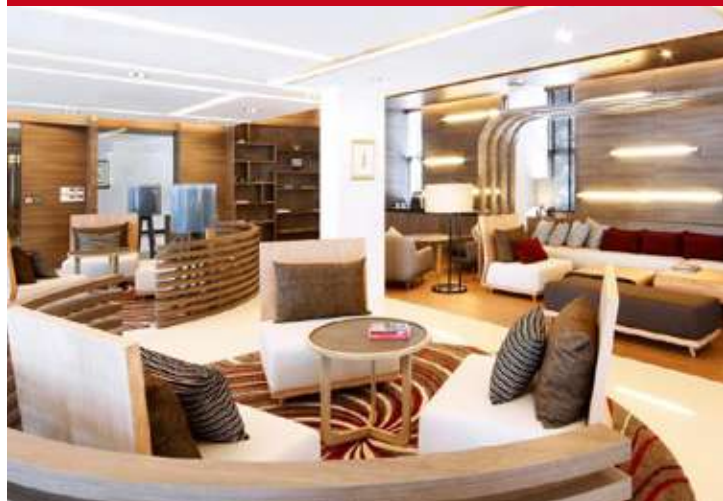
Classic Kameo Ayuthaya