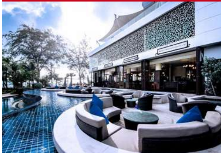
Graceland & Spa