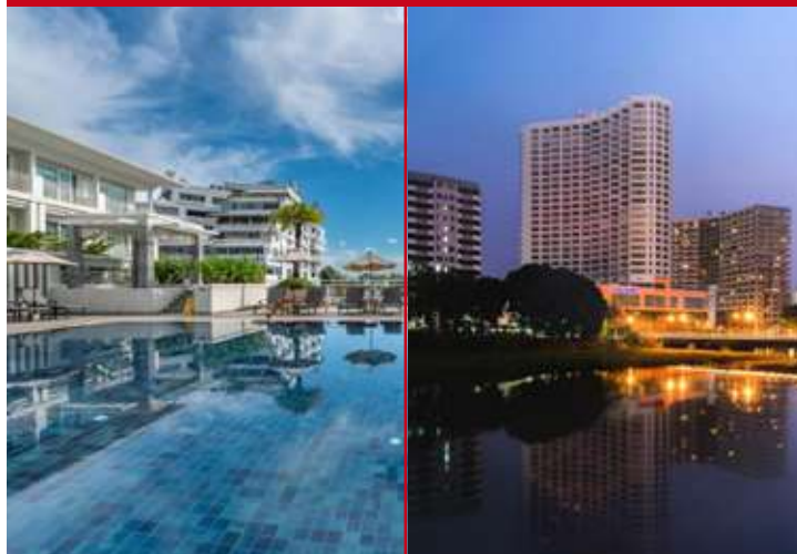
Kantary Hills ou Centara Riverside